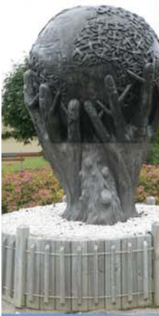
L'arbre du millénaire. Vision du passé, du présent et du futur - André Gamache - 2000