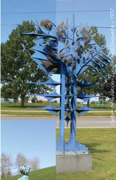
L'arbre de la nation - Luc-Bernard Duquette - 1972