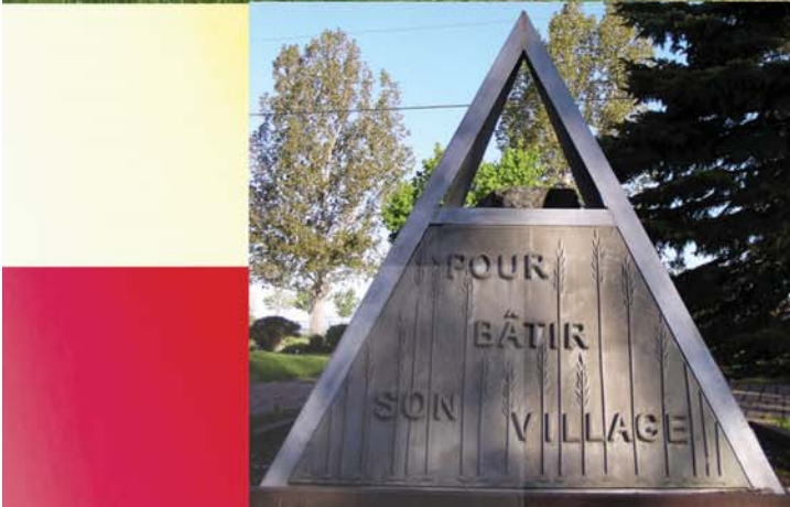
Le Caveau - Diane Carrier - 1996