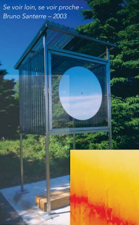
Se voir loin, se voir proche - Bruno Santerre - 2003