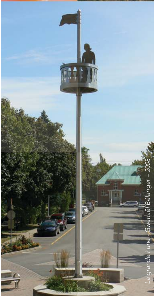
La grande hune - Gwenaél Bélanger - 2008