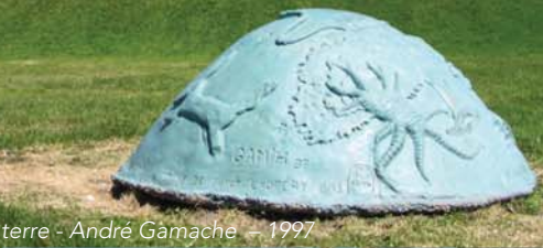
Le petit prince et la terre - André Gamache - 1997